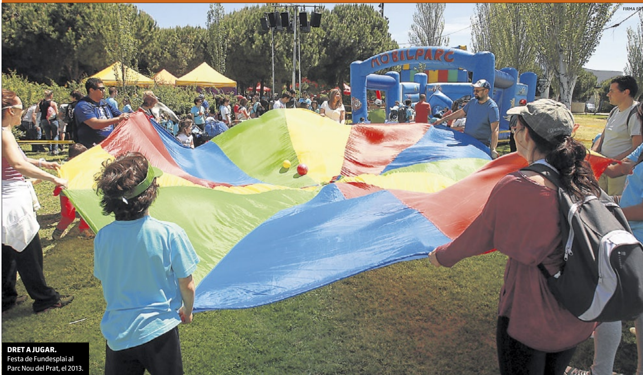
DRET A JUGAR. Festa de Fundesplai al Parc Nou del Prat, el 2013.