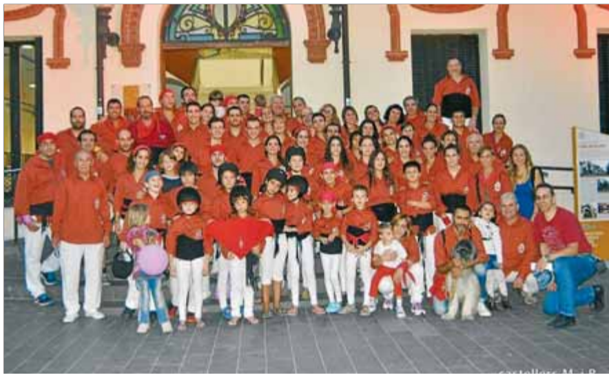
Els Castellers de Montcada i Reixac fa un any que han recuperat l'activitat

Els Castellers de Montcada i Reixac van recuperar l'activitat fa un any. La colla que havia començat a fer castells a principis dels noranta es va dissoldre per falta de recursos econòmics i també de gent el 1998. Ara es troben que, al cap un any de tornar a funcionar, els vénen a sobre tots uns tràmits fiscals i administratius que no saben ben bé com assumir. Ha estat una de les associacions que han buscat assessorament a Xarxanet.org, el portal posat en marxa fa dotze anys per Benestar Social i Família amb l'objectiu d'enfortir l'associacionisme i el voluntariat. “No ens podem permetre pagar una gestoria cada mes perquè ens porti els comptes”, planteja el presi-