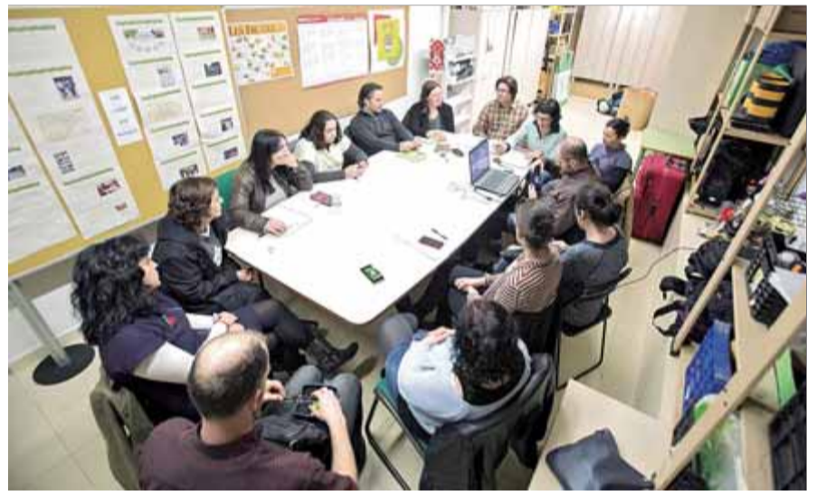
Pares i mares de l'AMPA de l'escola Mestre Gibert, reunits