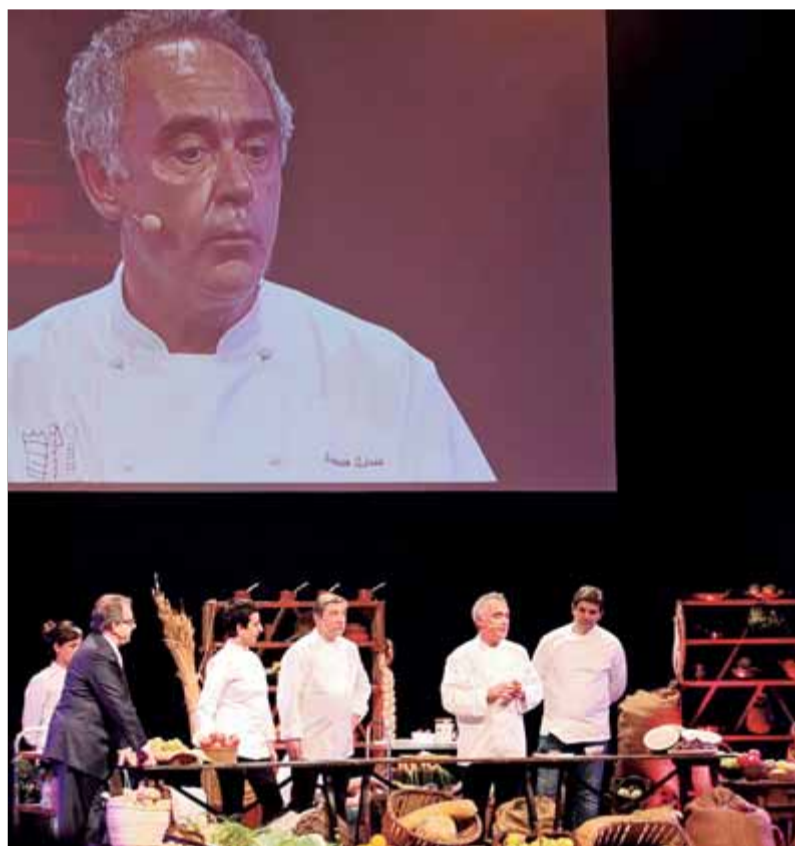
Els quatre cuines, en un moment del 'show' al teatre del Liceu