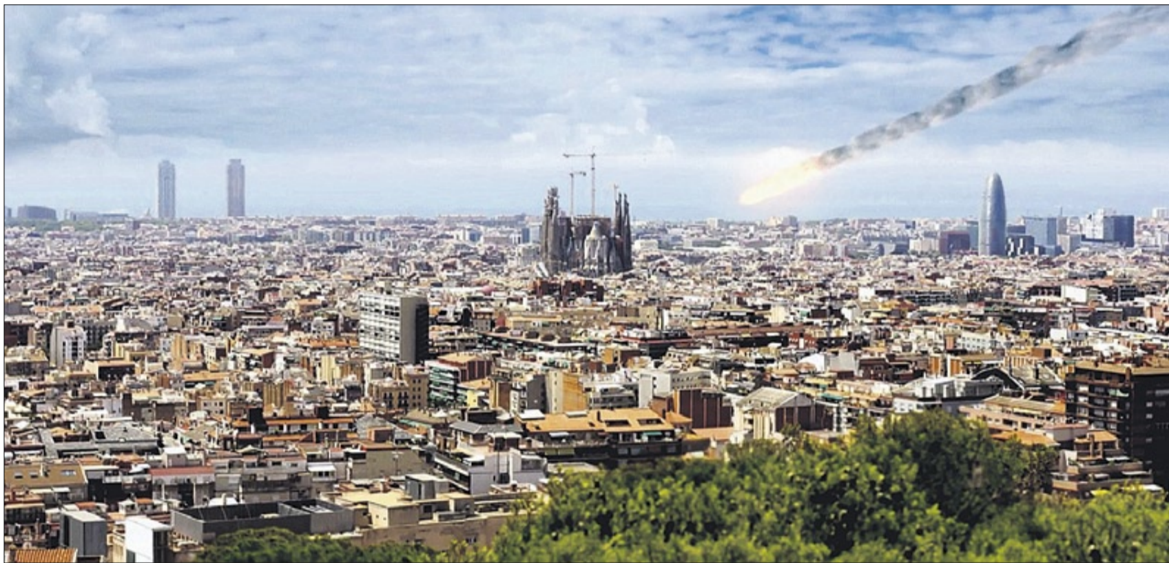
►► Un meteorit, a punt d'impactar contra la Sagrada Família, en un fotograma de la sèrie documental.

► La cadena estrena 'El fin del mundo: 10 formas de destruir la Tierra'