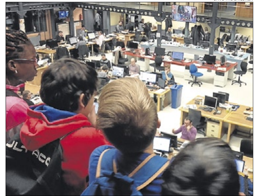
A LA REDACCIÓ. El grup de nens que va visitar EL PERIÓDICO al desembre.

Grups de Nou Barris i Sagrera de Save the Children