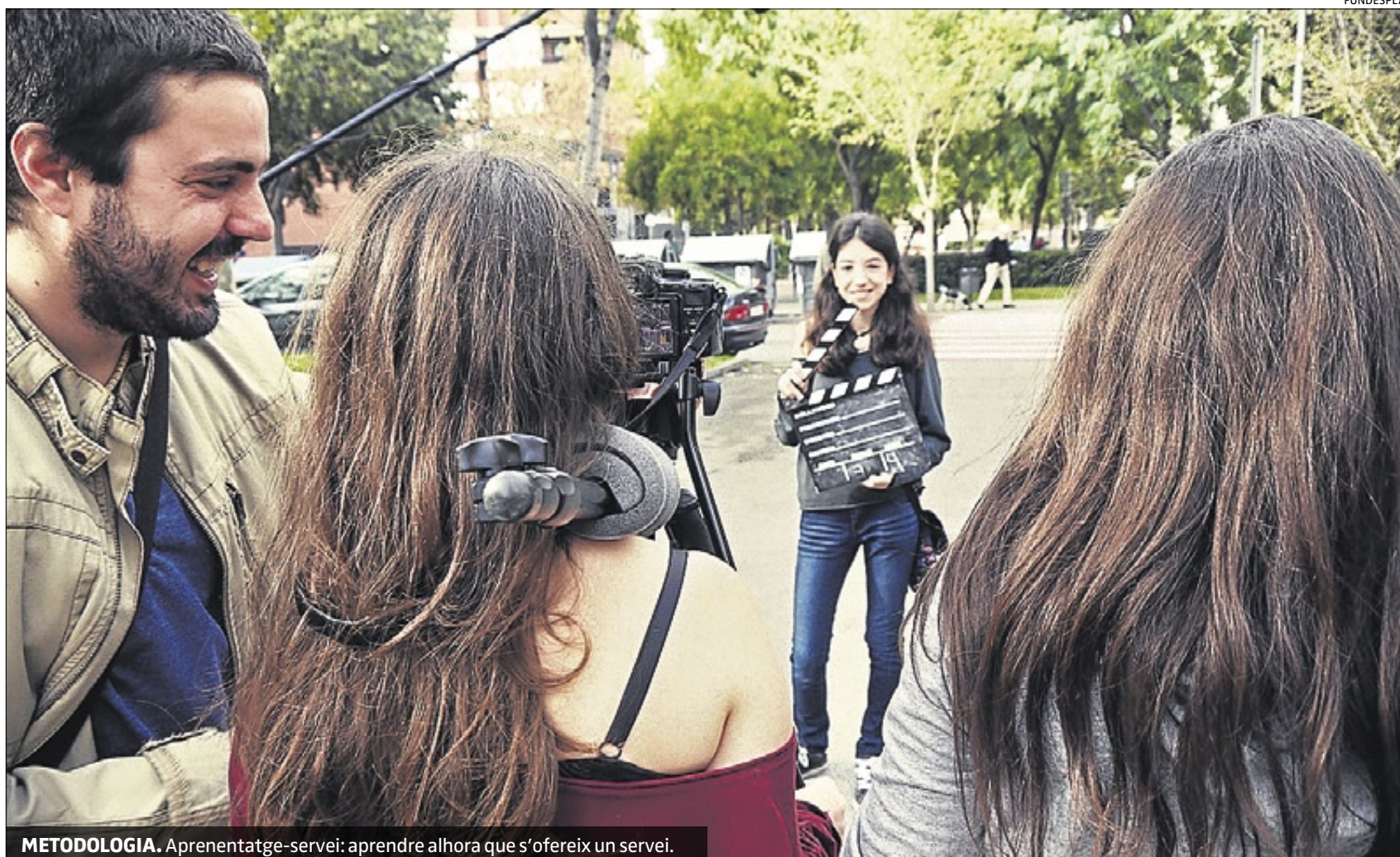
METODOLOGIA. Aprenentatge-servei: aprendre alhora que s'ofereix un servei.