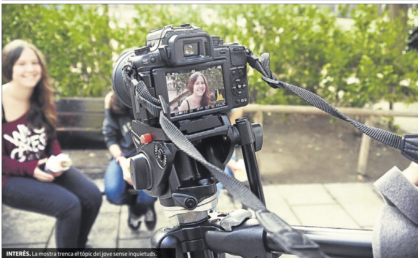
INTERÈS. La mostra trenca el tòpic del jove sense inquietuds.