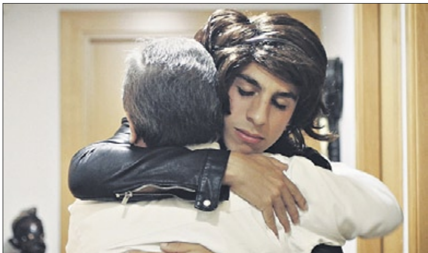
'TRÀNSIT'. Sobre la transsexualitat, de l'Esplai Font Santa Fatjó (Cornellà de Llobregat).