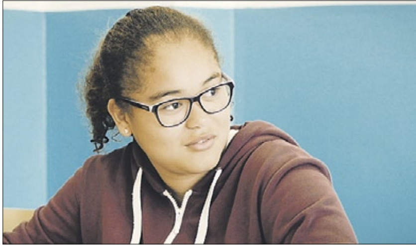
'ARRELS'. Sobre la pobresa, del Pubilla Cases-Can Vidalet (l'Hospitalet-Esplugues).