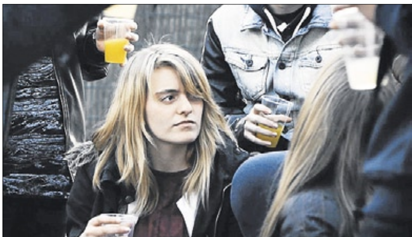
'NIT'. Sobre l'oci nocturn, del Centre d'Esplai El Nus (Sant Joan Despí).