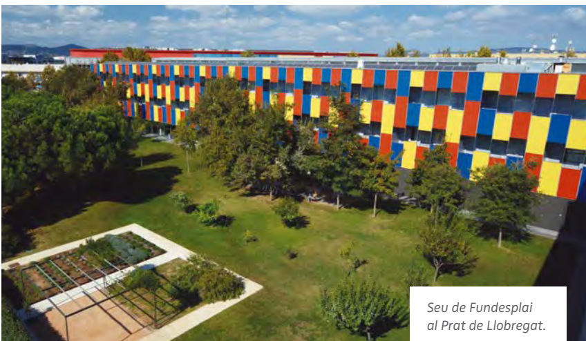
Seu de Fundesplai al Prat de Llobregat.