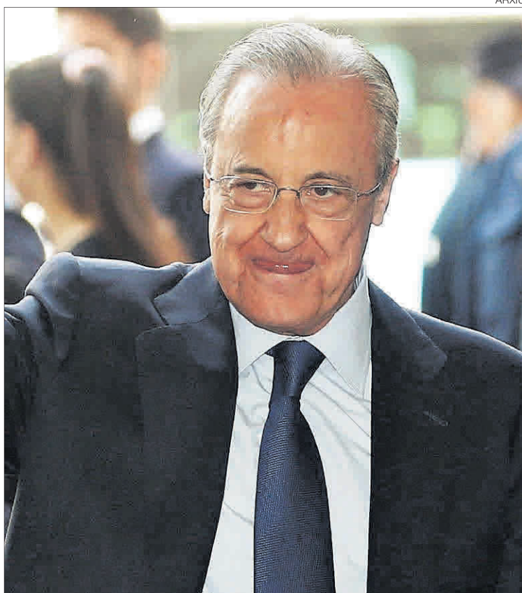
►► El president del Madrid, Florentino Pérez.

400.000 € DE COST // El Madrid tampoc ha informat del cost d'aquesta fusió per absorció que el portarà directament a l'elit del futbol femení, tot i que es podria acostar als 400.000 euros per quedar-se amb la plaça del CD Tacón, un club que acaba d'ascendir a Primera Divisió. Amb només cinc anys d'antiguitat ha aconseguit col·laborar-se entre els millors del país i