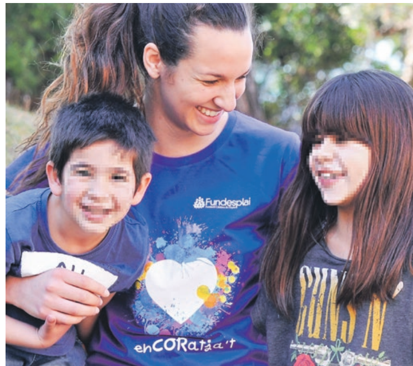
Dos infants i una monitora durant una activitat d'estiu.

Barcelona y Nueva York –escenarios de grandes luchas y revueltas por los derechos civiles– se abrazan de nuevo en esta conmemoración, poniendo en valor el pasado y los retos futuros, sin olvidar esos días de revuelta que nos inspiraron para siempre.